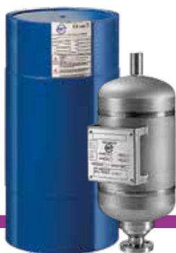
ГИДРАВЛИЧЕСКИЕ МЕМБРАННЫЕ ПОРШНЕВЫЕ АККУМУЛЯТОРЫ

BLADDER, DIAPHRAGM AND PISTON ACCUMULATORS