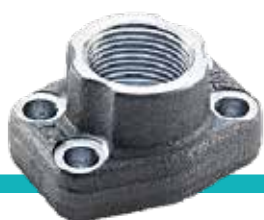
ФЛАНЦЫ МУФТЫ КОЛЛЕКТОРЫ КОРПУСА