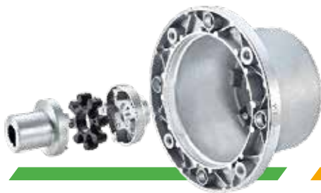
КОМПОНЕНТЫ И АКСЕССУАРЫ